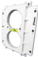
Rahmen mit Libelle