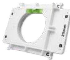
Rahmen mit Libelle