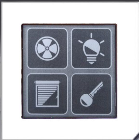
Abbildung zeigt LCN-G55 Rahmen mit LCN-MT4